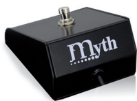
Footswitch FT-1, incluido en Myth 700B